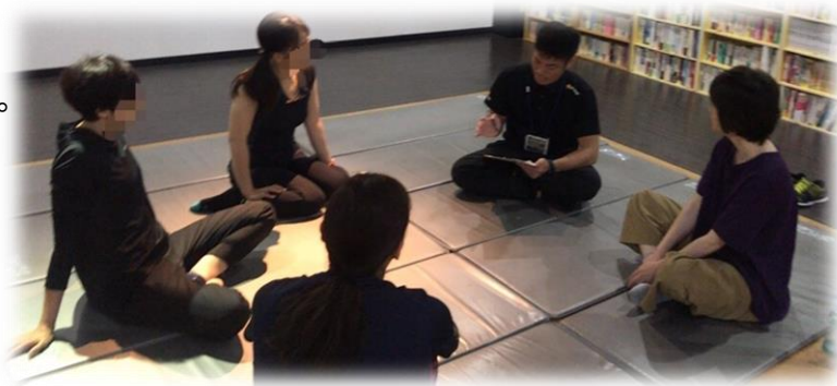
パーソナルトレーニングジム ダック